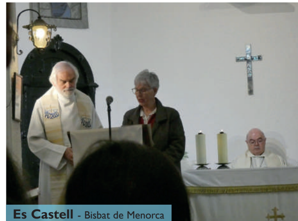
Es Castell - Bisbat de Menorca