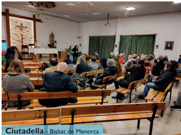
Ciutadella - Bisbat de Menorca