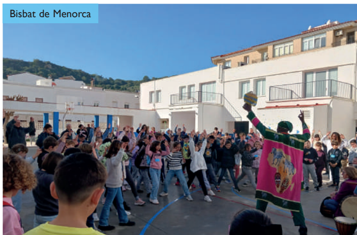
Bisbat de Menorca

El lema d'enguany era complementari del de l'any passat: si el 2024 reflexionàvem "compartesc el que som", enguany hem reflexionat "compartesc el que tenc". La reflexió va ser centrada per dos contes posats en escena per Victor Eguriase Uwagba, amb les