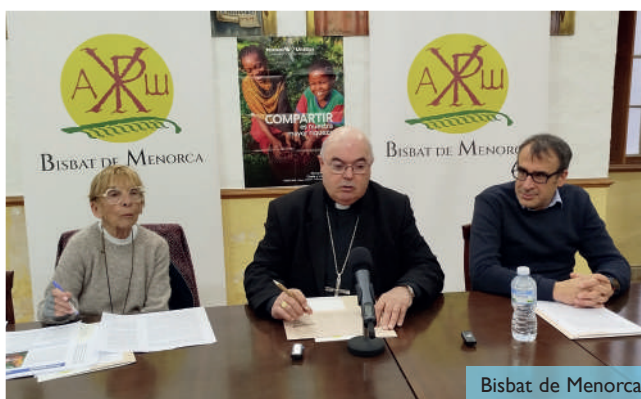
Bisbat de Menorca

L'any 2024 la societat menorquina va aportar 274 mil euros per donar suport als projectes de Mans Unides. Els projectes aprovats per Mans Unides Menorca l'any 2024 es van dur a terme a les Filipines, acompanyant i empoderant dones i filletes víctimes d'explotació sexual a Davao. Amb una aportació de 61.672 euros s'ajuda a 445 persones. Una altra iniciativa ha estat la Promoció de l'accés igualitari a l'educació per la població de Payatas (Manila), possibilitant l'accés dels fillets més vulnerables a l'educació. La quantitat aportada per Menorca ha estat de 29.392 euros.