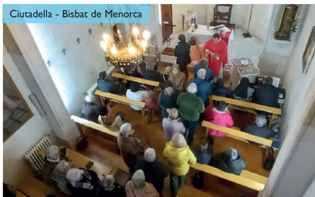
Ciutadella - Bisbat de Menorca

que una festa com la de sant Blai ens fa reflexionar sobre la importància de la salut del cos que tothom valora i cuida molt, però també ens ha d'animar a cuidar la salut de l'ànima, que és la que ens dona esperança per afrontar les adversitats amb l'ajuda de Déu. En el transcurs de les dues misses, a Ciutadella i Maó, es van beneir els panets de Sant Blai i els caramels, obsequis que van ser repartits al final de les misses a tots els presents.