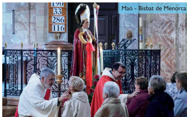
Maó - Bisbat de Menorca