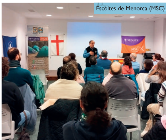
Escoltes de Menorca (MSC)

D ia 15 de febrer l'associació diocesana d'escoltisme va organitzar l'acte amb motiu del Dia del Pensament. Un moment durant l'any que s'aprofita, tot recordant Sir Ro-