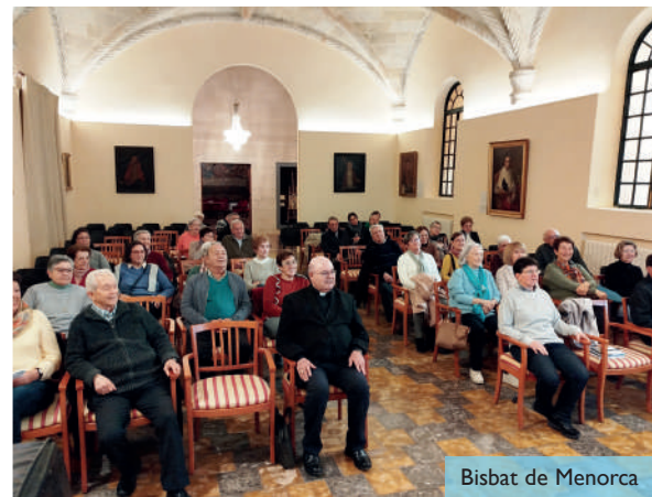
Bisbat de Menorca

presoner, del malalt". Després de la formació, es va obrir un temps de diàleg, en el qual diferents assistents van compartir el seu testimoni com a agents i voluntaris de pastoral de la salut.