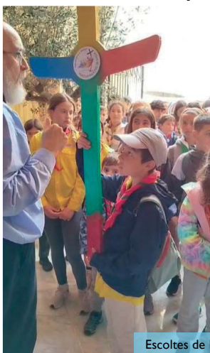
Escoltes de Menorca (MSC)