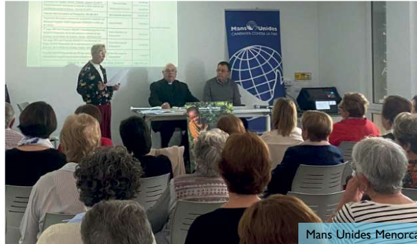
Mans Unides Menorca