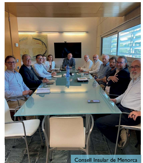
Consell Insular de Menorca

De forma simultània a la revisió del Pla Especial, es treballa en el projecte per a la reforma i la rehabilitació dels espais del BIC del Santuari, una actuació molt important que el Bisbat fa anys que té projectada i que encara no ha pogut emprendre. Un dels aspectes d'aquest projecte és l'habilitació d'espais per a una hostatgeria. El pla afecta el conjunt del Santuari. Està previst que la reforma del Pla Especial de l'ANEI es pugui presentar al Consell per tramitar-lo a finals d'aquest estiu.