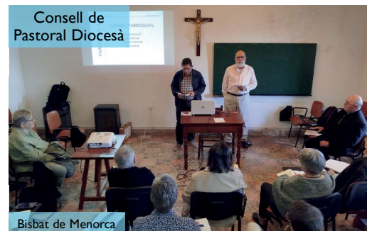
Consell de Pastoral Diocesà