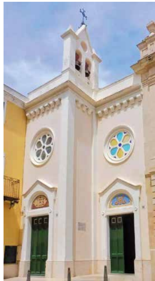
Convent de Concepcionistes de Maó

El segle XVII va estar marcat per una intensa activitat constructora. A més dels nous convents de Sant Diego i de la Concepció, es treballava en la reconstrucció dels de Sant Francesc i Santa Clara de Ciutadella, pràcticament enllestits cap al final de segle. Va ser precisament al final del segle XVII quan els franciscans de Maó van començar a construir l'actual edifici del convent, avui Museu de Menorca, que no s'acabaria fins molt entrada la centúria següent. També els agustins del Toro van aixecar un nou santuari sobre l'antic i van ampliar els edificis