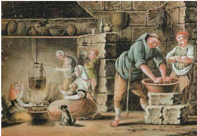
Frare ajudant en les porquejades, de Joan Chiesa

La composició dels ingressos dels diferents convents podia variar molt en funció de l'orde. Així, mentre els franciscans i carmelites no tenien propietats fora d'horts (com el convent de Sant Francesc i el d'antonians de Ciutadella) i tanques pròximes al convent (carmelites de Maó), els agustins del Socors i del Toro es convertirien en els segles XVII i XVIII en propietaris agrícoles.