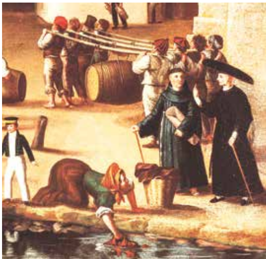
Frare franciscà amb un capellà al port de Maó (segle XIX)

Tanmateix, a final del segle XVIII ja són ben perceptibles signes de crisi que, amb el temps, acabarien afectant de manera irreversible el clergat regular. En realitat, ara ja no eren només els protestants els que criticaven durament els ordes religiosos, sinó que als països catòlics molts dels elements il·lustrats volien retallar dràsticament la seva influència, per exemple en l'àmbit de l'educació. A més, consideraven