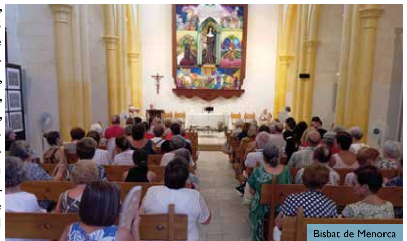
Bisbat de Menorca

En plena calor d'estiu, les germanes clarisses celebren la festa de Santa Clara. Uns dies que respiren pregària, retrobament, feina, família, amicitat, música, cant, poesia, ball, abraçades, convit i celebració. Tres dies abans de l'1 d'agost ens preparam per aquesta festa tan assenyalada per a nosaltres. Tres han estat els temes que han centrat la pregària del Tridu d'aquest any: alabança, fraternitat i contemplació. Tres aspectes fonamentals per a la persona de Santa Clara i les seves germanes pobres.