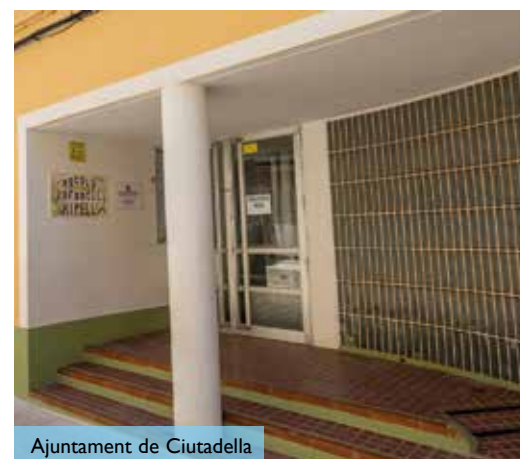
Ajuntament de Ciutadella

La Fundació Xipell Ciutadella de Menorca, 2 de setembre de 2025