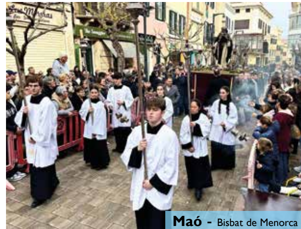
Maó - Bisbat de Menorca