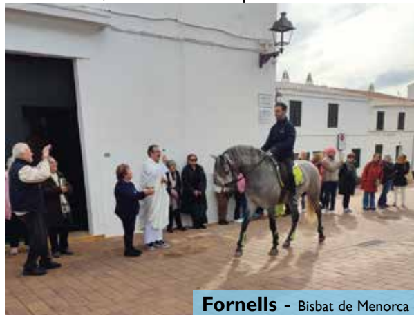
Fornells - Bisbat de Menorca

promoure la unitat i el testimoni de fe enmig de les circumstàncies actuals, per superar la polarització i la fragmentació que contemplam al nostre voltant". Després de la missa, es va celebrar la processó dels Tres Tocs pels carrers del poble. També es van celebrar misses en honor a Sant Antoni i beneïdes a Maó, Es Migjorn Gran, Es Mercadal, Fornells, Es Castell, Sant Climent i Sant Lluís. La missa de la Catedral es pot tornar a veure al canal de Youtube del Bisbat de Menorca.