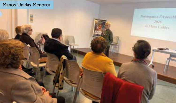
Manos Unidas Menorca