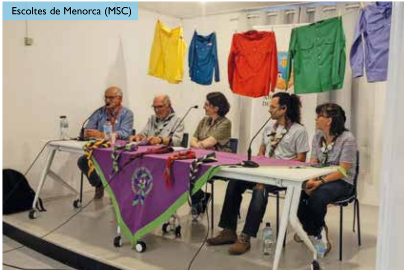
Taula rodona a Ferrerries. Dia 22 de maig de 2026